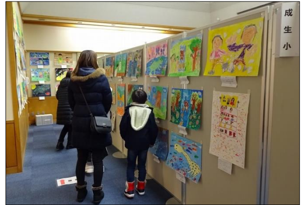
昨年の読書感想画展のようす