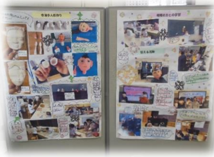
寺津小 4年生 寺津手人形の学習

この学習展のオープニングイベントとして、冬としては初めての『雪景色に映える明治の館』ステンドグラスライトアップ鑑賞会を行い、60名ほどのお客様が当館の雪景色を楽しまれました。高揃小学校4年生から出品された竹やペットボトルを使ったランタンも一緒に飾ったところ、とても煌びやかに演出され、幻想的な雰囲気にも包まれた二日間でした。