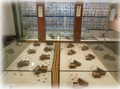
津山小 4年生 手書きの将棋駒